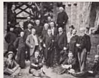
Het Sint Bernulphusgilde anno 1900.