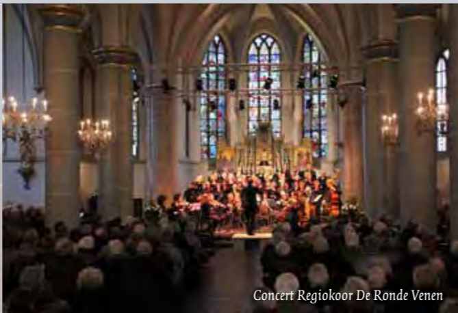
Concert Regiokoör De Ronde Venen

DIT VIERTLUIK IS MEDE MOGELIJK GEMAAKT DOOR: