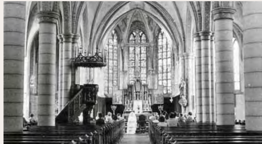
Het interieur van de kerk tot 1969.