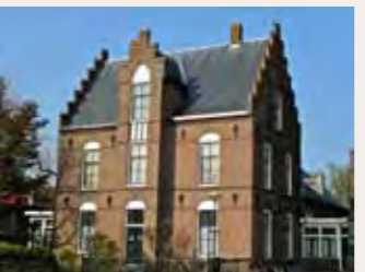
De pastorie, ook deel van het monument.