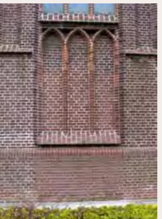
Dichtgemetselde ingang Wilnisszijde (1939). Let ook op het metselwerk dat zo typerend is voor deze bouwstijl.