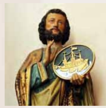
31 Sint Jozef F.W. Mengelberg, 1879

Hier uitgebeeld als patroon van de kerk door het schild met voorstelling van het schip der kerk (uitgeroepen in 1870).