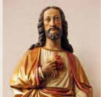
14 H. Hart van Jezus F.W. Mengelberg, 1879