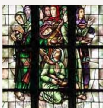
28 De Wijze en de Dwaze Maagden Matteüs 25:13

Op de voorgrond de Samaritaan met het slachtoffer en rechts de Leviet die voorbij ging.