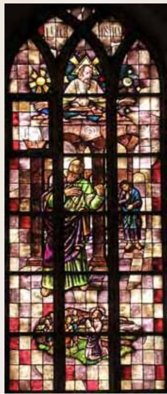
3 Het Gebed Lucas 18:9