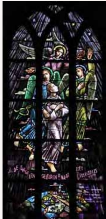
6 De engelen geleiden u naar het paradijs ('In Paradisum...')