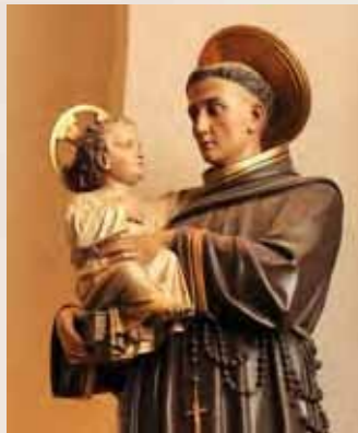
1 Antonius van Padua