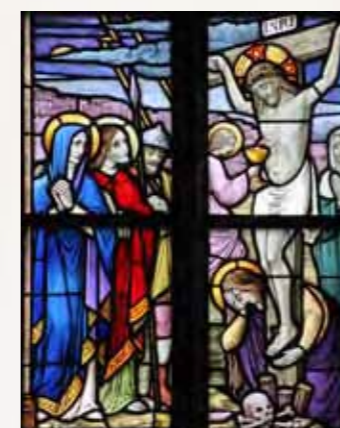
22 Kruisiging van Jezus

De schedel verwijst naar (1) Golgotha (schedelplaats), (2) plaats van het graf van Adam, (3) de oude Adam is gestorven.