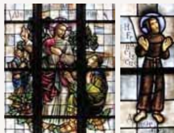
25 De Rijke Jongeling Matteüs 19:11

Kapel van Maria van Altijdurende Bijstand, 1940 Koperwerk (1950), W. Kloosterman, Tilburg. Kapel op de plaats van de in 1939 dichtgemetselde ingang voor de gelovigen uit Wilnis.