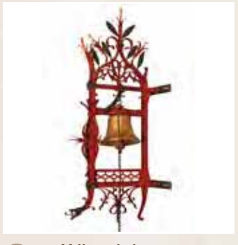
15 Bel bij sacristie G.B. Brom