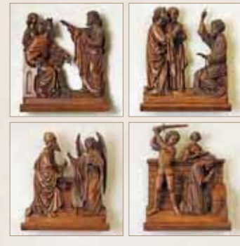
9 10 Schrijnwerk afkomstig van de oude preekstoel 11 12 F.W. Mengelberg, 1880

Ga door de nauwe poort naar binnen. Want de brede weg, die velen volgen, en de ruime poort, waar velen door naar binnen gaan, leiden naar de ondergang. (Naar verluud is dit een uniek raam voor Nederland.)