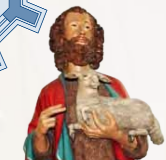
21 H. Johannes de Doper F.W. Mengelberg, 1879