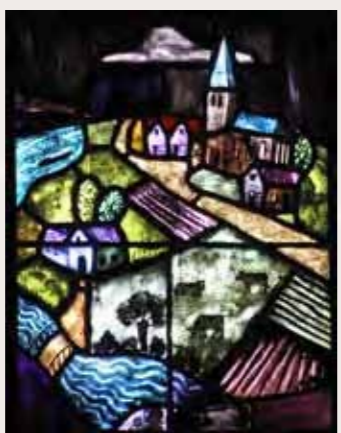
6 het dorp Mijdrecht met de Protestantse Janskerk.

Op de voorgrond de farizeeër die met zijn duim wijst naar de tollenaar achter hem.