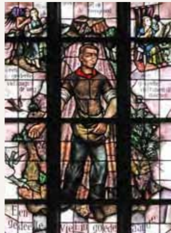
7 De Zaaier Matteüs 13:38

De akker is de wereld; het goede zaad dat zijn de kinderen van het koninkrijk; het onkruid dat zijn de kinderen van het kwaad.