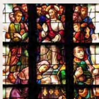
30 Het Penninkske van de Weduwe Lucas 21:4

Hier uitgebeeld als patroon van de kerk door het schild met voorstelling van het schip der kerk (uitgeroepen in 1870).