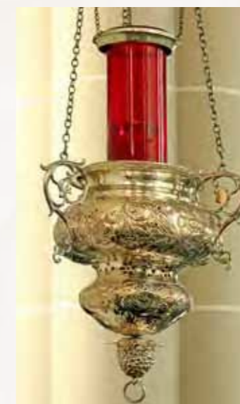
20 Godslamp Sigismund Zschammer, 1666