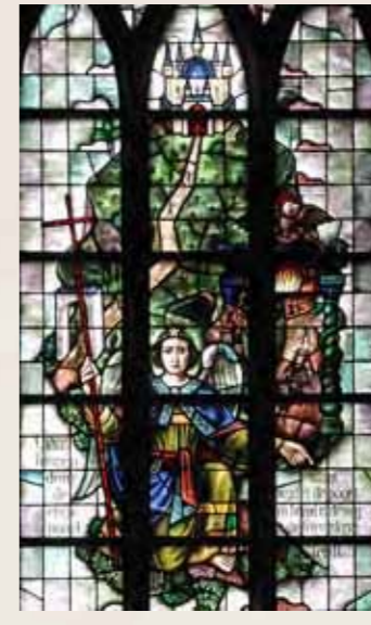
8 De Twee Wegen Matteüs 7:13

Ga door de nauwe poort naar binnen. Want de brede weg, die velen volgen, en de ruime poort, waar velen door naar binnen gaan, leiden naar de ondergang. (Naar verluud is dit een uniek raam voor Nederland.)