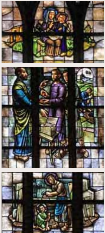
5 De Talenten Matteüs 25:14