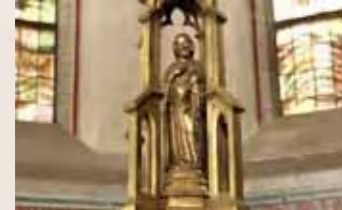
2 Doopkapel met doopvont G.B. Brom, 1887