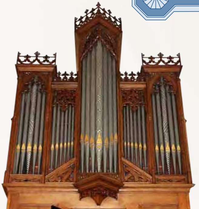
23 Orgel M. Maarschalkerveerd, 1879

De schedel verwijst naar (1) Golgotha (schedelplaats), (2) plaats van het graf van Adam, (3) de oude Adam is gestorven.