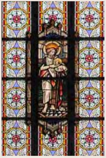
13 Johannes de Doper (patroon van deze kerk)